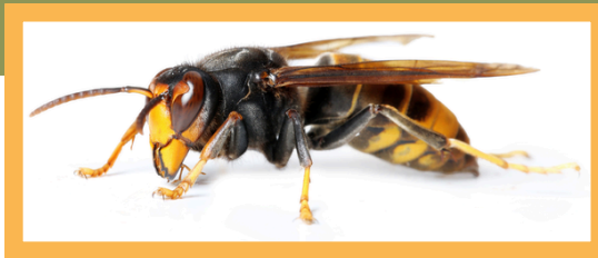
Frelon asiatique à pattes jaunes Vespa velutina nigrithorax

Outil du Plan de lutte régional, le piégeage au printemps des fondatrices de frelon asiatique à pattes jaunes a pour objectif de faire baisser la pression de prédation sur les colonies d'abeilles en limitant l'implantation de nids à proximité. Il doit s'accompagner de bonnes pratiques et d'un protocole de suivi présentés ci-dessous pour limiter son impact sur les autres espèces.