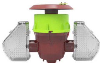
Piège coréen à ailes